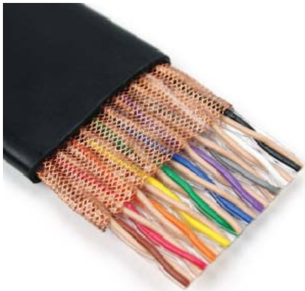
图3 带有金属屏蔽层的双绞的平板电缆

也可以在电缆周围采用额外的金属屏蔽层来增强驱动器电缆对磁场的抗扰能力。图3中预装了金属屏蔽层的电缆（如3M™的1785系列产品）是可以购买到的。